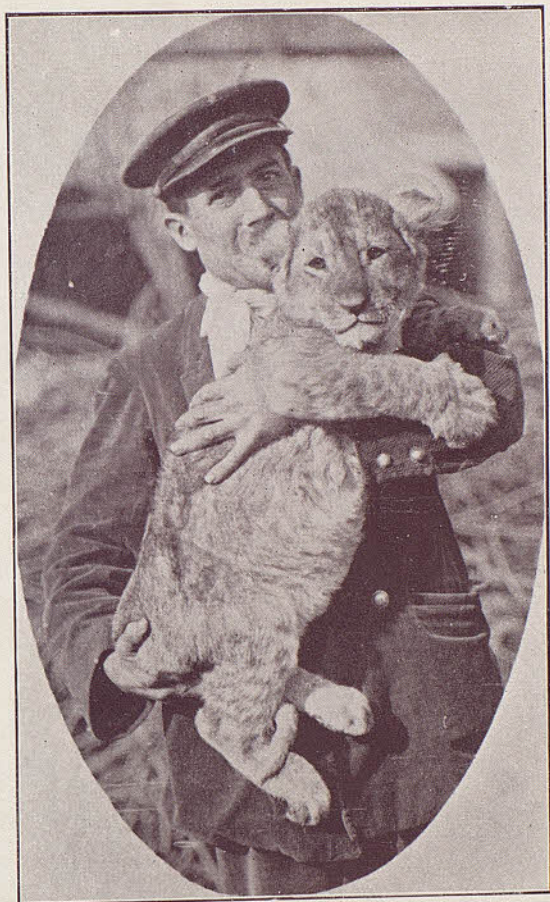
Reproducció dels Lleons: Un dels cadells de tres mesos i mig d'edat.